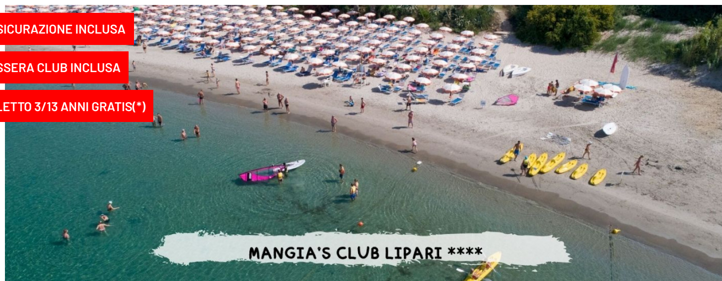
quote a persona in all inclusive – tessera club inclusa – camera standard