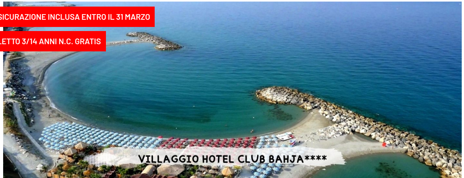
VILLAGGIO HOTEL CLUB BAHJA****