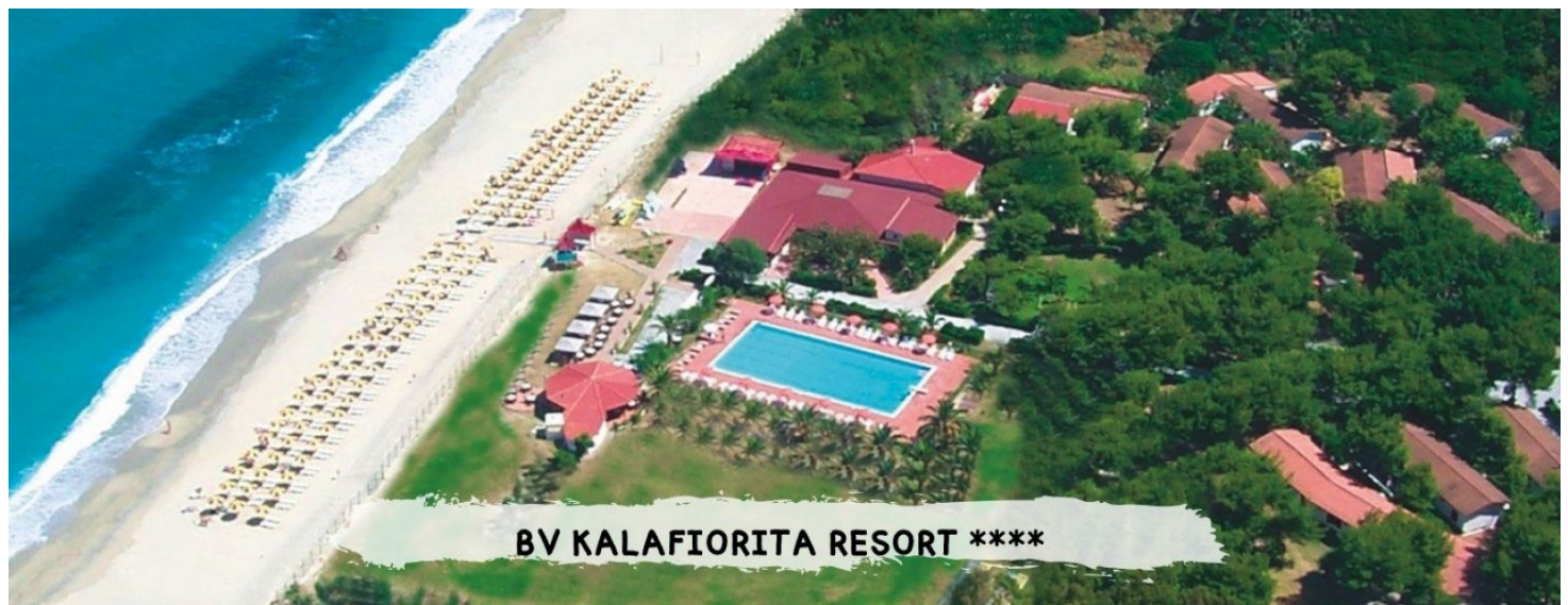
BV KALAFIORITA RESORT ****