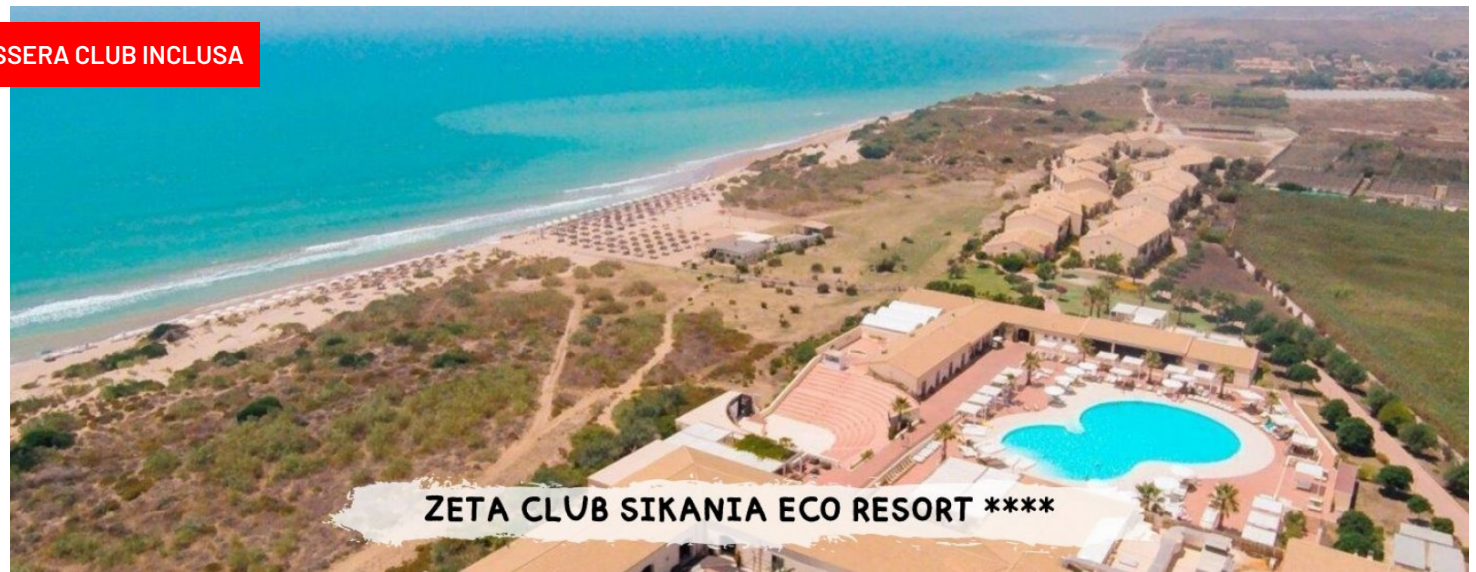
ZETA CLUB SIKANIA ECO RESORT ****

quote a persona in camera standard doppia pensione completa con bevande ai pasti ( minimo 25 partecipanti)