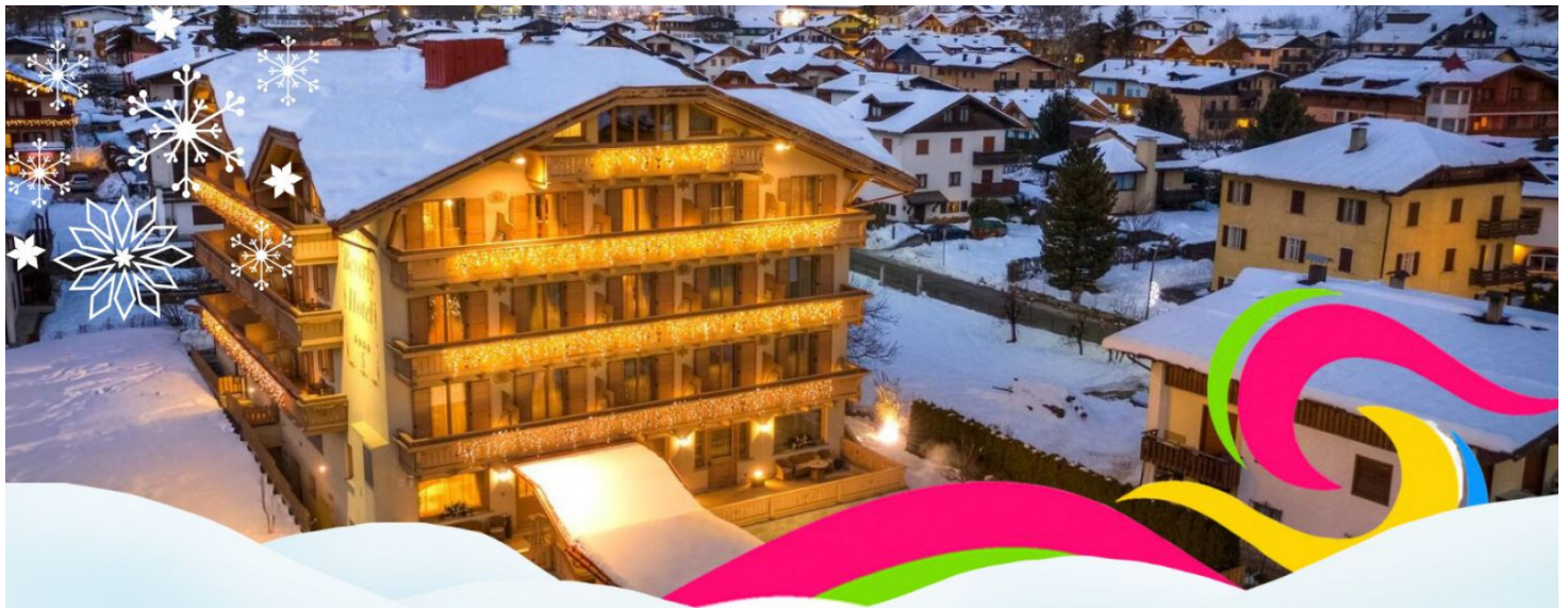
Tariffa per persona al giorno in camera e colazione - Tariffa netta valida dal 01/11/25