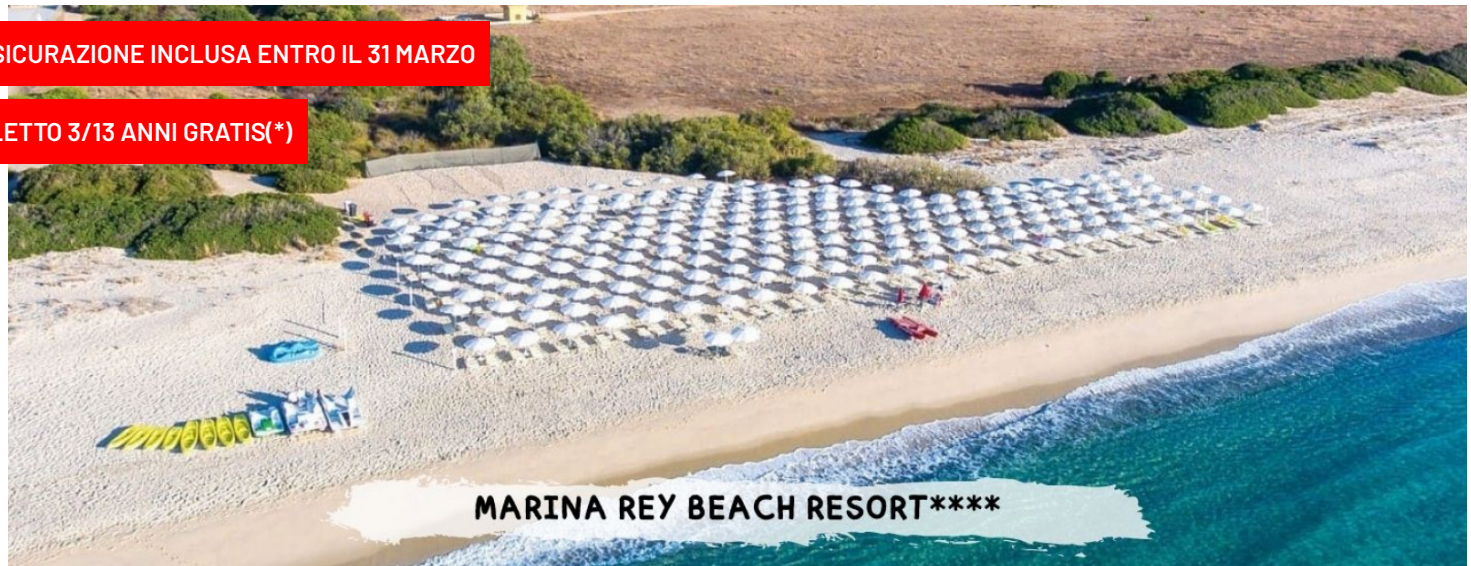
MARINA REY BEACH RESORT****

PER LE TUE SETTIMANE SPECIALI CLICCA QUI