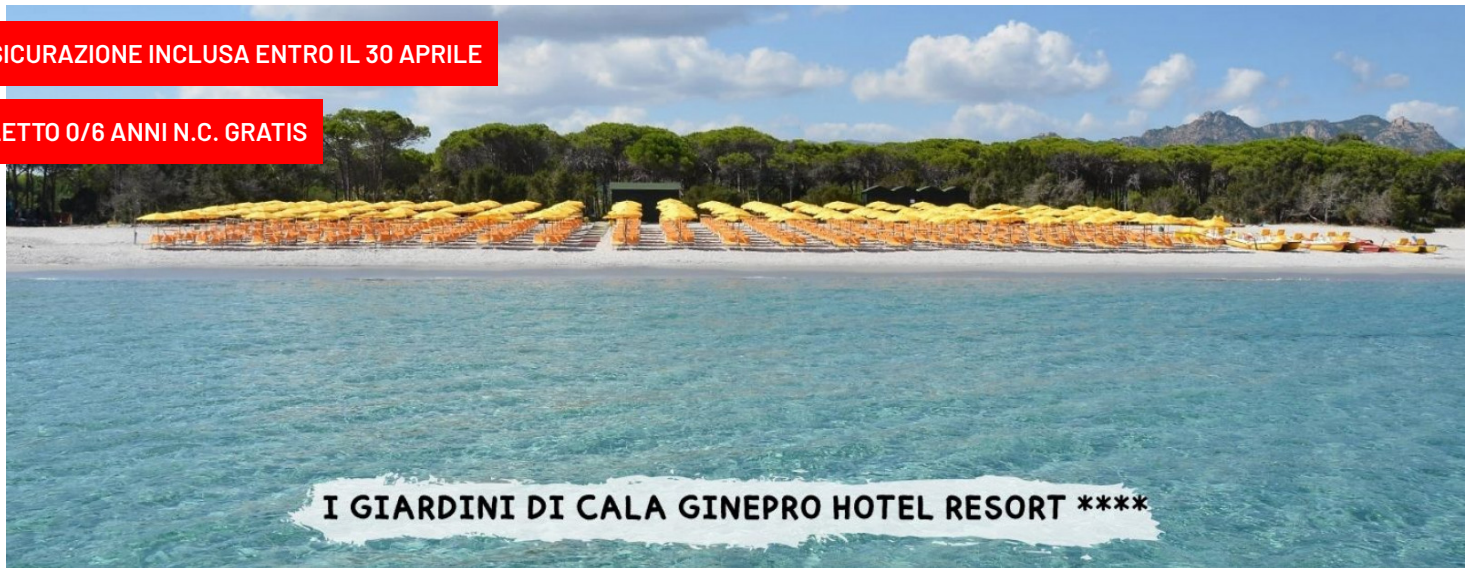
I GIARDINI DI CALA GINEPRO HOTEL RESORT ****