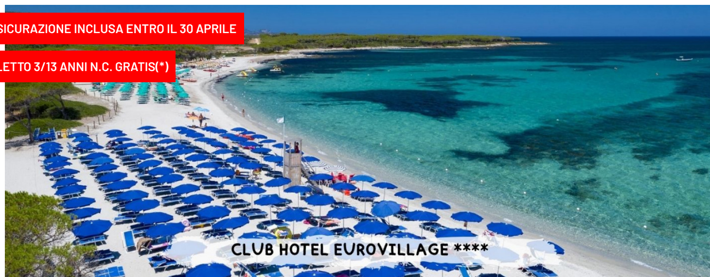
CLUB HOTEL EUROVILLAGE ****