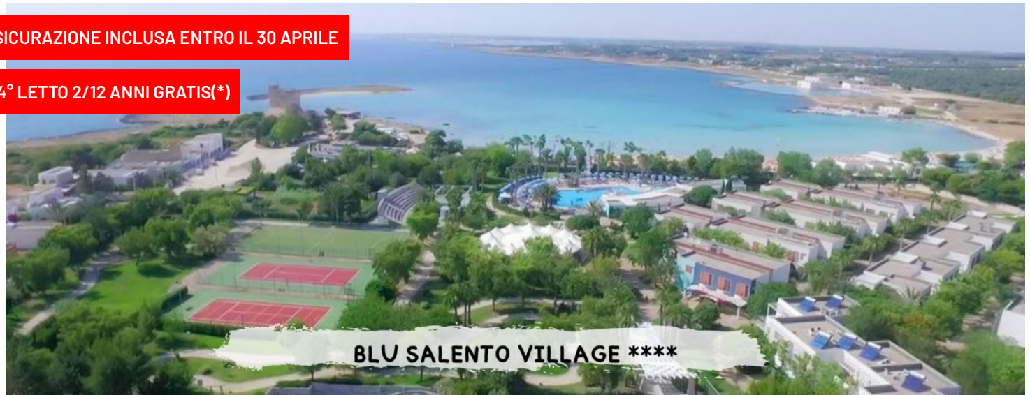
BLU SALENTO VILLAGE ****