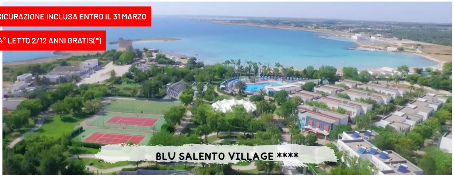
BLU SALENTO VILLAGE ****