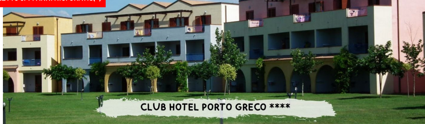
CLUB HOTEL PORTO GRECO ****