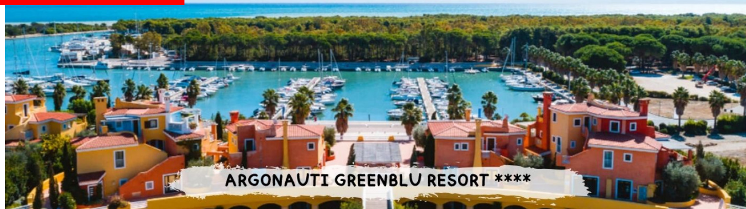
ARGONAUTI GREENBLU RESORT ****